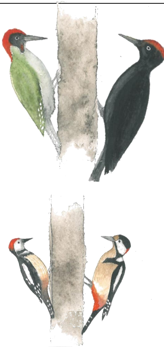
Schwarzspecht ( Dryocopus martius )