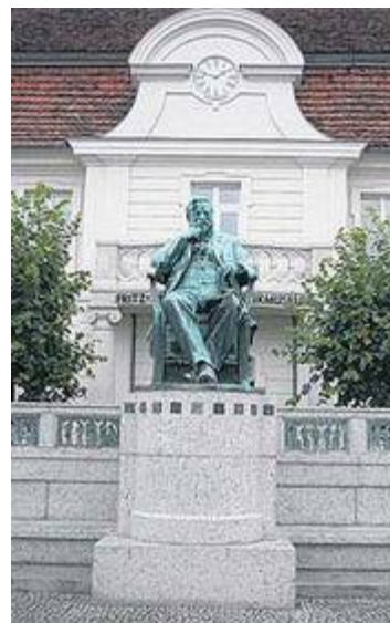
Das Fritz-Reuter-Denkmal Marktplatz Stavenhagen